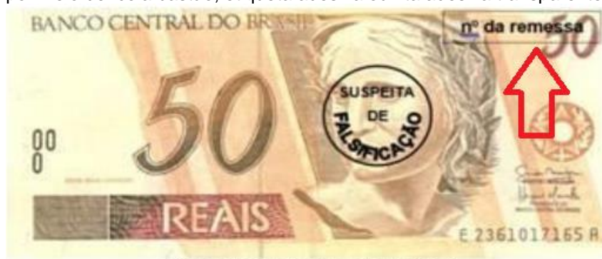
Exemplar de cédula da primeira família do Real